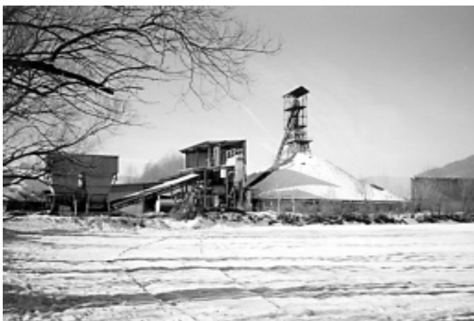
Fa. Rumpold: Wachsam bleiben!